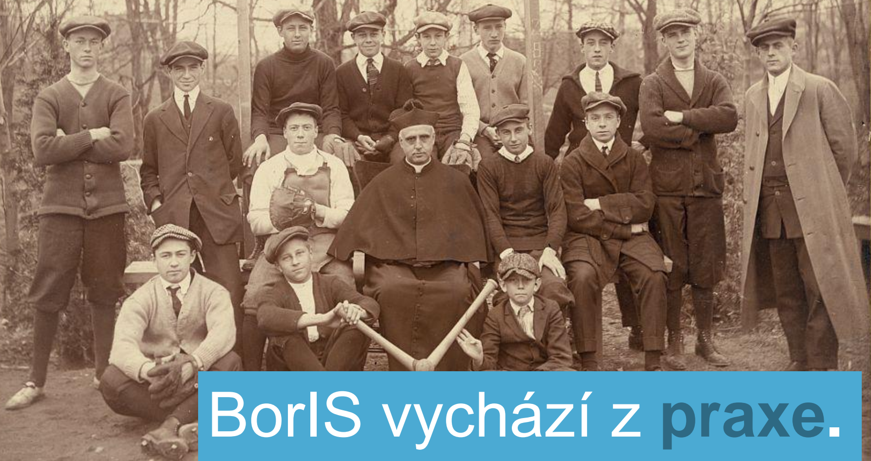
Borls vychází z praxe.